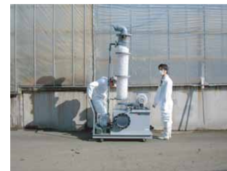
堆肥化設備排気スクラパーテスト