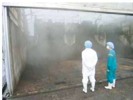
コンサルテーション