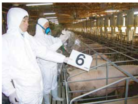
コンサルテーション臭気採取