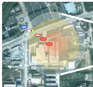
対策前臭気発生状況