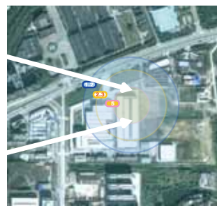
対策後臭気発生状況