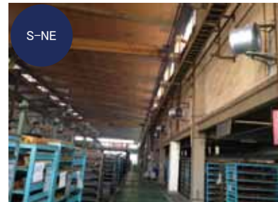
中子エリア消臭剤噴霧設備